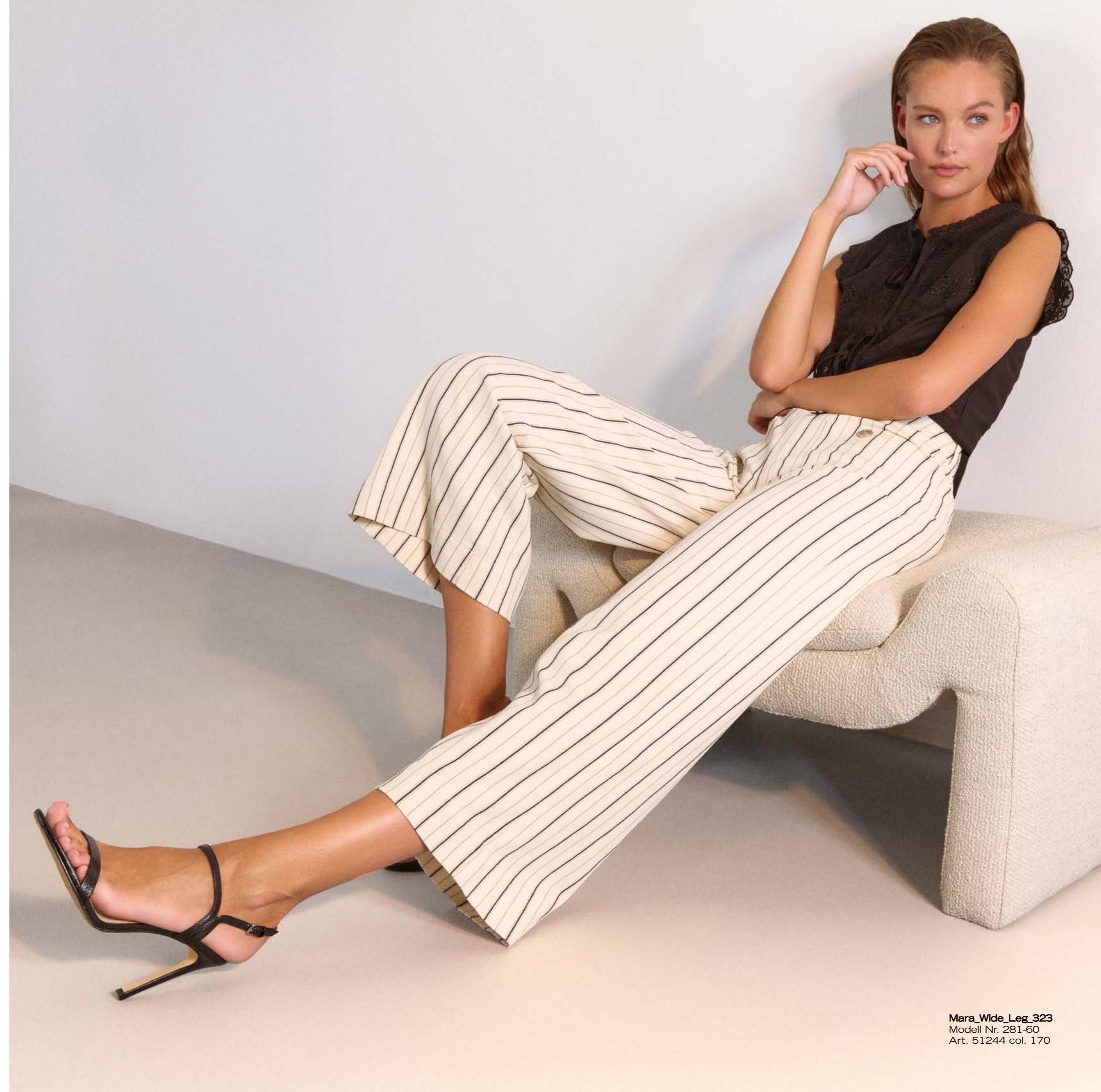
Mara_Wide_Leg_323 Modell Nr. 281-60 Art. 51244 col. 170