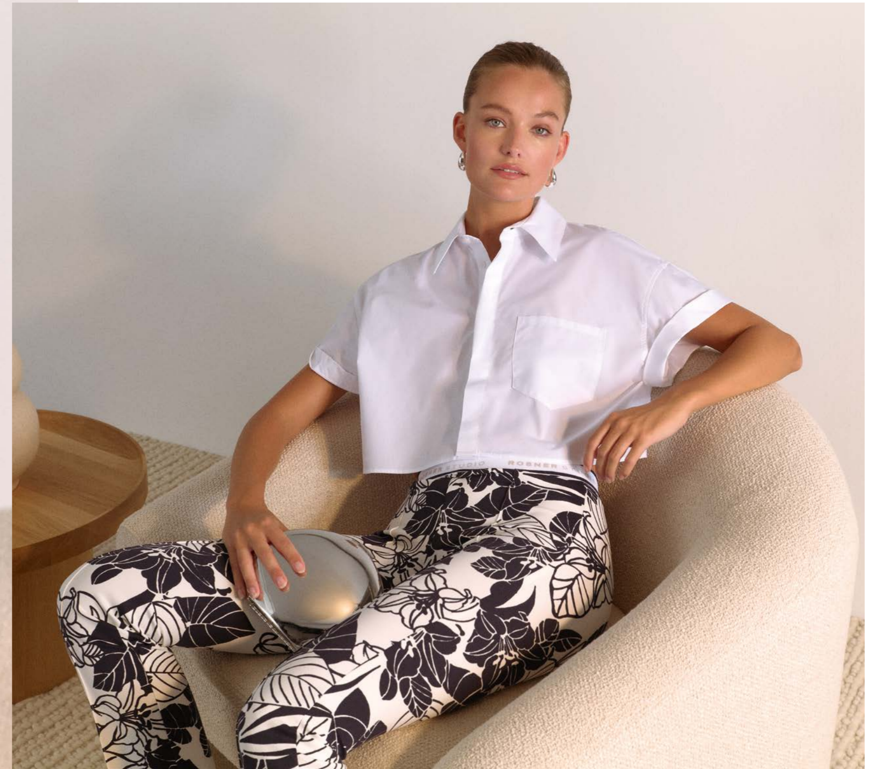
Alisa_Slim_296 Modell Nr. 452-88 Art. 51743 col. 389