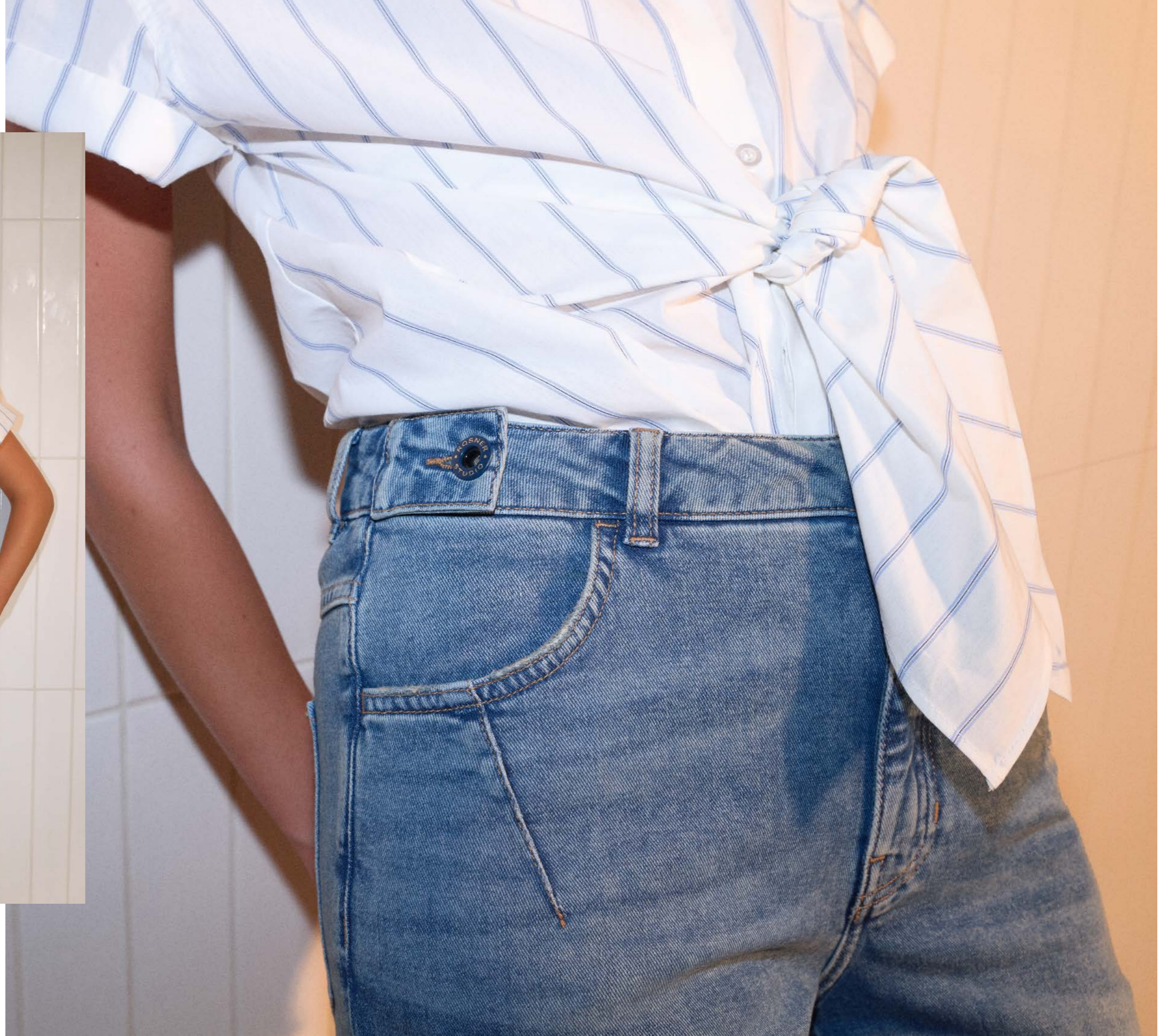
Mera_Straight_375 Modell Nr. 281-58 Art. 51982 col. 356