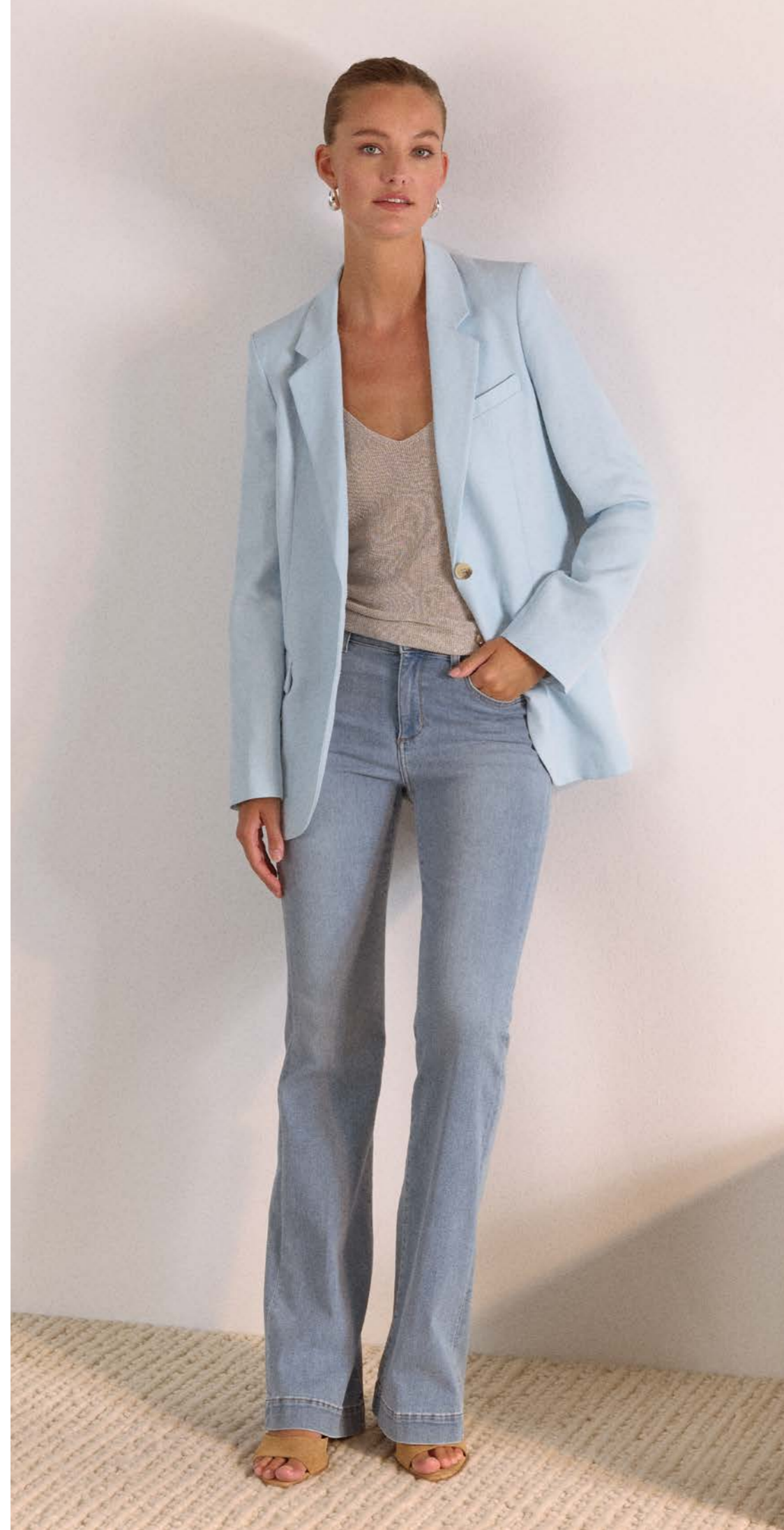
Antonia_Bootcut_341 Modell Nr. 1039-71 Art. 51916 col. 312